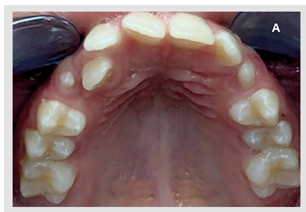
Figura 2. Fotografía intraoral de la arcada superior donde se observa la presencia del diente supernumerario

Al realizar el examen clínico intraoral se observó una dentición mixta con tejidos blandos normales, mala alineación de piezas dentarias y presencia de biofilm. Así también, se evidenció la presencia de un diente supernumerario suplementario con mal posición dentaria en la hermiarcada superior derecha, localizado en el sector palatino, entre el