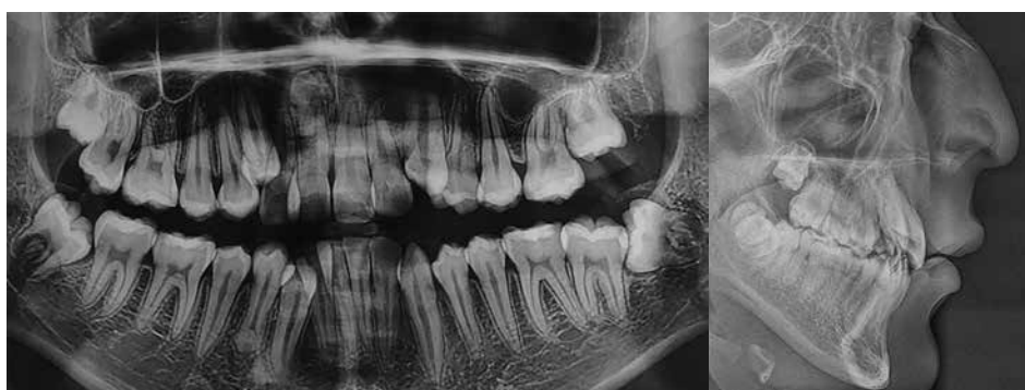
Figura 1. Imagen radiopaca en la raíz de la pieza 11, compatible con supernumerario

Las radiografías arrojaron la presencia de un supernumerario invertido a nivel de la pieza 11. Se ordenó la tomografía computarizada de haz cónico (CBCT) para evaluar en 3 dimensiones el número y la posición correcta del diente supernumerario. En este caso, la etiología exacta de los dientes supernumerarios no podía relacionarse con ningún factor de herencia, ya que la historia familiar no era relevante. (ver Figura 2).