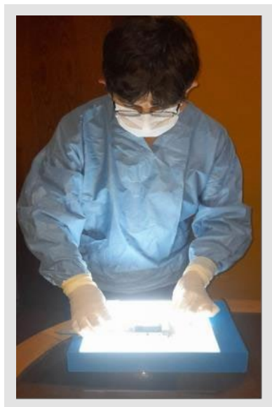
Figura 1. Medición de las piezas dentales

relación entre variables se hizo uso de la prueba no paramétrica de chi-cuadrado y para establecer la efectividad de los métodos de estimación de edad dental se hizo uso de la prueba ANOVA a través del uso del sistema informático SPSS.