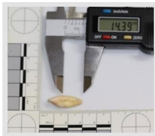
Figura 2. Medición de la longitud radicular

El estudio se realizó en piezas dentales de personas que habían sido extraídas previamente por motivos muy ajenos a esta investigación, y antes de que esas piezas dentarias sean desechadas fueron realizadas mediciones para obtener la información deseada en esta investigación; por lo tanto, durante el estudio no se estuvo en contacto con ninguna persona a quienes pertenecían las piezas dentales. Se respetó el derecho a la confidencialidad y privacidad, protegiendo la información brindada por los centros odontológicos.