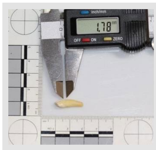
Figura 4. Medición de la periodontosis

Existen diferencias significativas entre el método de Ubelaker y el de Bang Ramm, con un p-valor menor a la significancia ( 0,032 < 0,050 ); así como entre el método de Lamendin y el de Bang Ramm ( 0,004 < 0,050 ); mientras que entre los métodos