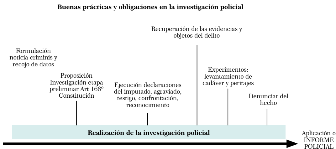
Figura 1 Esquema de buenas prácticas y obligaciones protocolares que deben ser tenidas en cuenta en la redacción del Informe Policial