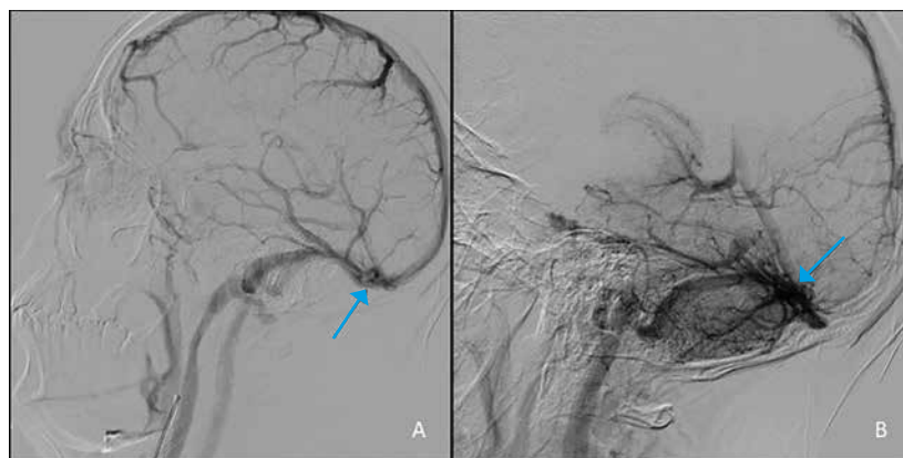
Figura 2. Angiotomografía computarizada: A) malformación arteriovenosa dependiente de la circulación de las arterias comunicantes posteriores; B) nido vascular de MAV a nivel temporo-occipital izquierdo

convexidad del cráneo. Después de inyectar contraste se evidenció llenado adecuado de vasos arteriales y venosos. La circulación anterior no presenta alteración; sin embargo, en la circulación posterior se revela hipoplasia de arterias comunicantes posteriores más ruptura de malformación arteriovenosa cerebral temporo-occipital con vaso nutricio aislado en hemisferio cerebral izquierdo (ver Figura 2).